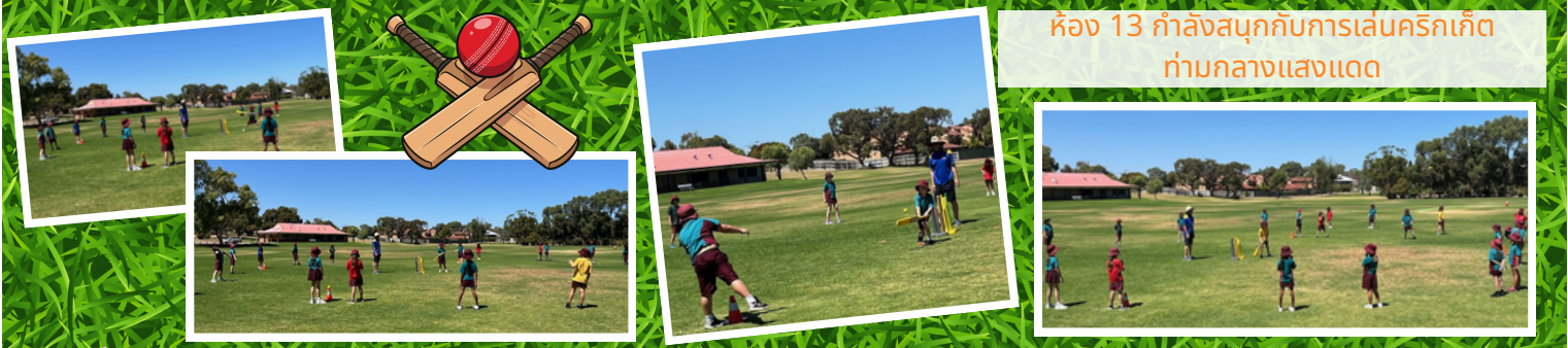
ห้อง 13 กำลังสนุกกับการเล่นคริกเก็ตท่ามกลางแสงแดด