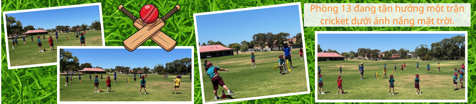
Phòng 13 đang tận hưởng một trận cricket dưới ánh nắng mặt trời.