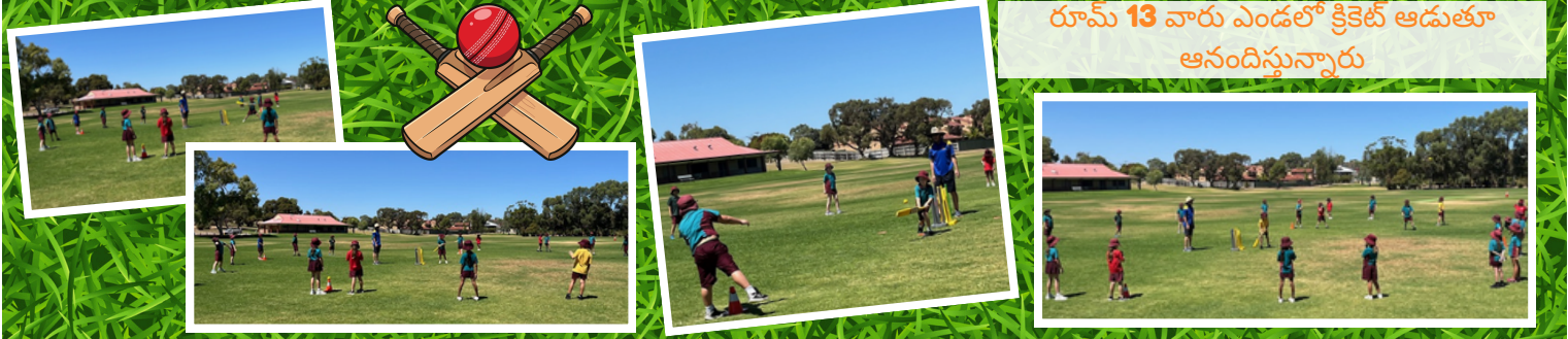
రూమ్ 13 వారు ఎండలో క్రికెట్ ఆడుతూ ఆనందిస్తున్నారు